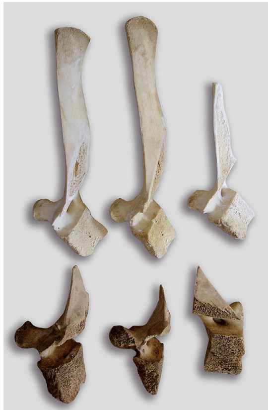
236 Titz-Rödingen. Bearbeitete Tierknochen.

Für einen differenzierten Vergleich eignen sich nur Rind und Schwein, liegen doch von den übrigen Haus- und Wildtieren nur Einzelwerte vor. Bei der Zerlegung der Schlachtkörper vom Rind wurde vorzugsweise das Beil verwendet, bei der Zerlegung der Schweine häufiger das Messer. Die wenigen Schaf-